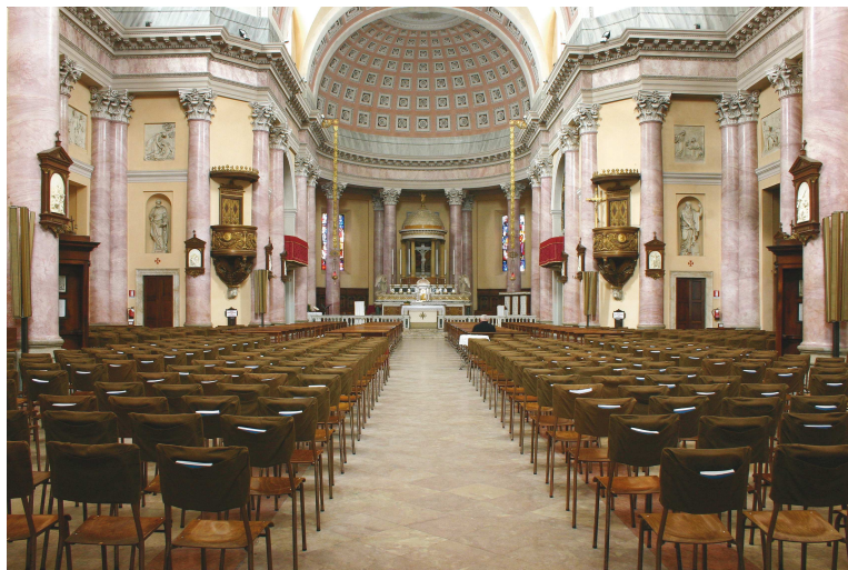
Fig. 2. Gorgonzola, Chiesa parrocchiale dei SS. Protaso e Gervaso

Nell'Archivio Parrocchiale si trovano libri mastri e carteggi la cui attenta lettura ha permesso di conoscere nel dettaglio le fasi costruttive e decorative dell'intera fabbrica. Anche nell'Archivio dell'Ospedale Serbelloni di Gorgonzola - pure esso sorto per volontà del duca Gian Galeazzo (progetto di Giacomo Moraglia, 1848-1860) - sono conservati materiali inerenti la costruzione della chiesa: le due opere ebbero, infatti, una committenza e un'amministrazione comuni, pertanto le loro vicende e i loro Archivi si intrecciano in modo inesorabile sino alla metà del Novecento. A questi due Archivi si è affiancata la lettura degli atti della visita pastorale, che interessò Gorgonzola e la sua pieve nel 1851 5 : significativamente, l'unico nome di artista ricordato in occasione della descrizione dell'edificio sacro è proprio Cacciatori. I nuovi dati ora a nostra disposizione confermano che l'attività di Cacciatori per la chiesa di Gorgonzola non terminò nel 1820, ma nemmeno entro la seconda metà di quel decennio: lo scultore fornì le prime opere già nel 1819 e l'ultimo documento nel quale compare il suo nome è datato 1849. Inoltre, sulla base delle fonti d'archivio, devono essere attribuite a Cacciatori anche sette sculture la cui paternità era precedentemente incerta.