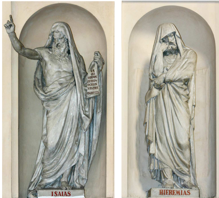
Figg. 7 e 8. B. Cacciatori, Isaia e Geremia , 1822, gesso

conto della loro posizione, ai lati dell'altare; poiché l'unica altra figura di cui è noto il soggetto - S. Girolamo - fu posta in opera solo nel 1839 nei pressi della porta principale, si può ipotizzare che la consegna e relativa installazione delle dodici opere sia proceduta dall'altare verso l'ingresso tra il 1822 e il 1840. Il saldo finale, verosimilmente, comprese anche la dodicesima statua della quale i documenti non segnalano esplicitamente la data di consegna.