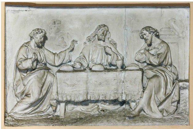
Figg. 14 e 15. B. Cacciatori, Resurrezione di Lazzaro , 1848, stucco; F. Meda su disegno di A. Comolli, Cena in Emmaus , 1880, stucco

Per quanto riguarda gli autori dei tre rilievi, in una lettera che Parrocchetti indirizzò al segretario del Legato Pio Serbelloni il 19 luglio 1880 l'architetto nomina il "pittor Comolli e lo scultore Meda" affermando che le tre opere erano pronte per essere spedite. Si tratta di Francesco Meda (Milano, attivo nella seconda metà del XIX secolo) 20 , che compare nei cataloghi dell'Accademia di Brera in qualità di partecipante alle esposizioni annuali del 1863, 1865, 1867, 1879 e 1881 21 , e di Ambrogio Comolli (Milano 1830 - Induno Olona, Varese 1913), pittore, formatosi a Brera, assistente scenografo di Carlo Ferrario alla Scala negli anni Sessanta e Settanta 22 . Il 31 dicembre 1881 il pittore fu liquidato per queste opere, mentre non risulta alcun compenso a Meda, che probabilmente eseguì i tre bassorilievi seguendo il disegno fornitogli da Comolli e fu pagato direttamente da lui 23 . Ad un'attenta lettura, le tre formelle denunciano una certa leziosità (soprattutto nell'insistenza "teatrale" del panneggio), che le differenzia nettamente dalle tredici opere sicuramente di mano di Cacciatori, mentre per quanto riguarda i soggetti è quasi certo che ci si attenne al programma