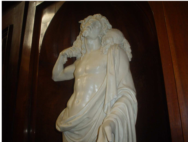
Fig. 17. B. Cacciatori, Buon Pastore

Purtroppo la scultura non presenta alcuna firma, né tantomeno una data o una sigla: l'attribuzione di quest'opera a Benedetto Cacciatori è suffragata solo da questa annotazione del 1851, che fu sicuramente basata su testimonianze dirette. Il riferimento a Giuseppe Antonio Nicolini, prevosto parroco di Gorgonzola dal 1794 alla morte, avvenuta l'8 dicembre 1838 all'età di 75 anni 26 , permette di datare l'opera tra il 1819-20 e il 1838: vale a dire tra l'anno delle prime importanti realizzazioni di Cacciatori per la chiesa di Gorgonzola e la morte del parroco cui egli donò la scultura. La scultura è stata restaurata nel 2007: si è provveduto a rimuovere le precedenti verniciature e a ricostruire la mano sinistra, che presentava delle dita mancanti 27 .