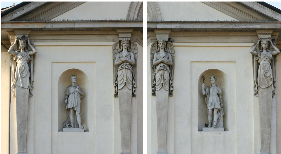
Figg. 3 e 4. B. Cacciatori, Angeli-Cariatidi , 1819, stucco

Le prime realizzazioni in assoluto per la chiesa dei SS. Protaso e Gervaso furono le quattro cariatidi “di stucco forte” che, nella parte superiore della facciata, sostengono il timpano: risalgono al 1819 e sono assegnate alla mano di Cacciatori in questa sede per la prima volta 6 .