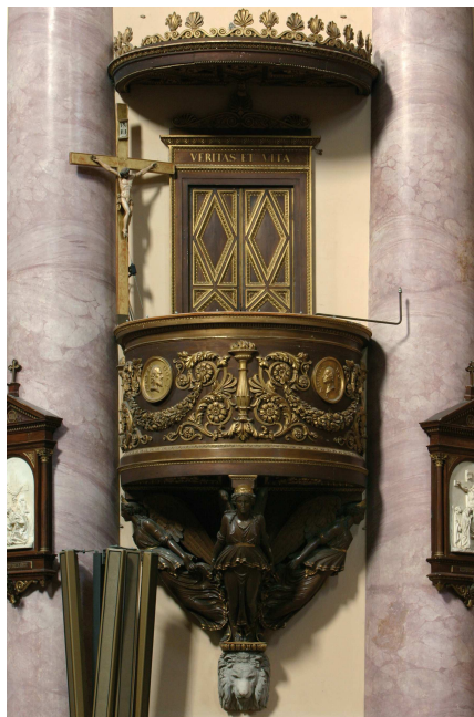
Fig. 19. Uno dei due pulpiti: alla base la testa di leone di Cacciatori

Un ultimo intervento, che solo lo spoglio dei documenti d'archivio ha permesso di ricondurre alla mano dello scultore carrarese, è costituito da due teste di leone in marmo bianco di Carrara 30 . Questi elementi sporgono dai pilastri settentrionali della cupola, a circa due metri di altezza, e sorreggono i due imponenti pulpiti in legno di noce messi in opera nel 1832. Il disegno di tali strutture finemente intagliate e dorate, ciascuna delle quali si imposta su tre angeli-cariatidi collocati tra le teste leonine e la balaustra, si deve a Domenico Moglia (Cremona 1782 - Milano 1867) 31 . Gli autori della carpenteria lignea sono Giuseppe Arrigoni, Giovanni Cartella e Carlo Ripamonti (Milano, attivi prima metà del XIX secolo).