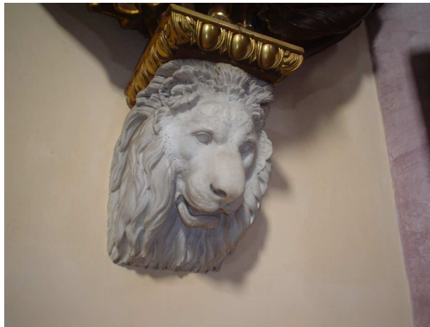
Fig. 18. B. Cacciatori, Testa di leone, 1832, marmo di Carrara

Un ultimo intervento, che solo lo spoglio dei documenti d'archivio ha permesso di ricondurre alla mano dello scultore carrarese, è costituito da due teste di leone in marmo bianco di Carrara 30 . Questi elementi sporgono dai pilastri settentrionali della cupola, a circa due metri di altezza, e sorreggono i due imponenti pulpiti in legno di noce messi in opera nel 1832. Il disegno di tali strutture finemente intagliate e dorate, ciascuna delle quali si imposta su tre angeli-cariatidi collocati tra le teste leonine e la balaustra, si deve a Domenico Moglia (Cremona 1782 - Milano 1867) 31 . Gli autori della carpenteria lignea sono Giuseppe Arrigoni, Giovanni Cartella e Carlo Ripamonti (Milano, attivi prima metà del XIX secolo).