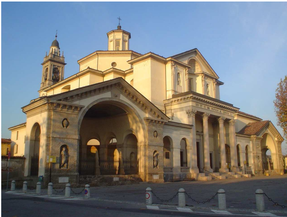
Fig. 1. Gorgonzola, Chiesa Parrocchiale dei SS. Protaso e Gervaso

La chiesa parrocchiale di Gorgonzola, dedicata ai martiri Protaso e Gervaso, caratterizza da poco meno di due secoli questa località dell'Est milanese. Il complesso monumentale - costituito dalla chiesa, dal mausoleo della famiglia Serbelloni, dall'oratorio della SS. Trinità e dal campanile - fu voluto dal duca Gian Galeazzo Serbelloni, signore del luogo, il quale incaricò del progetto l'architetto ticinese Simone Cantoni, autore anche del palazzo di famiglia a Milano, sull'attuale corso Venezia. Mentre la cappella sepolcrale fu edificata nel 1776, gran parte del complesso fu realizzato tra il 1806 e il 1881, in esecuzione del legato testamentario del duca, scomparso nel 1802. Al compimento del grandioso disegno neoclassico, ideato in sostituzione della vecchia chiesa parrocchiale che sorgeva sulla medesima area, concorsero numerose personalità del panorama artistico del tempo, molte delle quali provenienti dall'ambiente accademico di Brera: gli scultori Benedetto Cacciatori e Stefano Girola, il professore di Ornato Domenico Moglia, gli stuccatori Giovanni Porta e Carlo Cattori, i pittori Domenico Pozzi, Agostino Comerio e Filippo Bellati, l'architetto Giacomo Moraglia e suo figlio Pietro 1 .